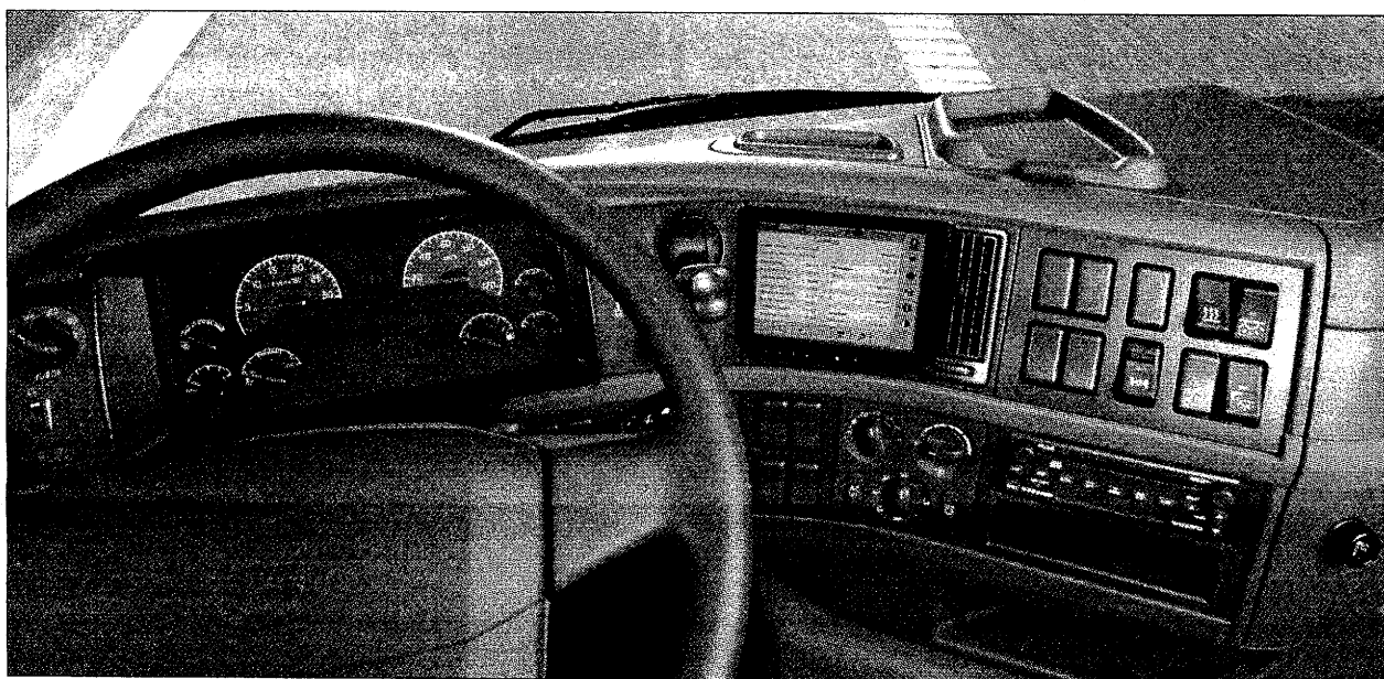
En Comlog-terminal på arbejde.