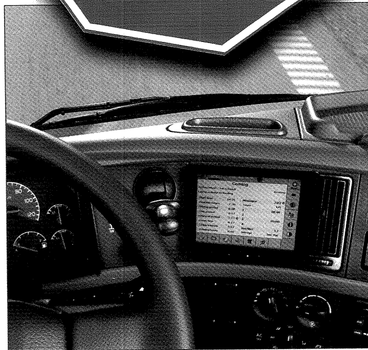
ComlogFlex terminalen, der er den mest avancerede billøsning i Comlogs produktprogram rummer både GPS-positionering, registrering af køredata og kommunikation.

den, der så selv kan fylde egne nøgletal ind - altså, hvad tjener han per kilometer, hvor mange kilometer kører hans lastbiler osv.